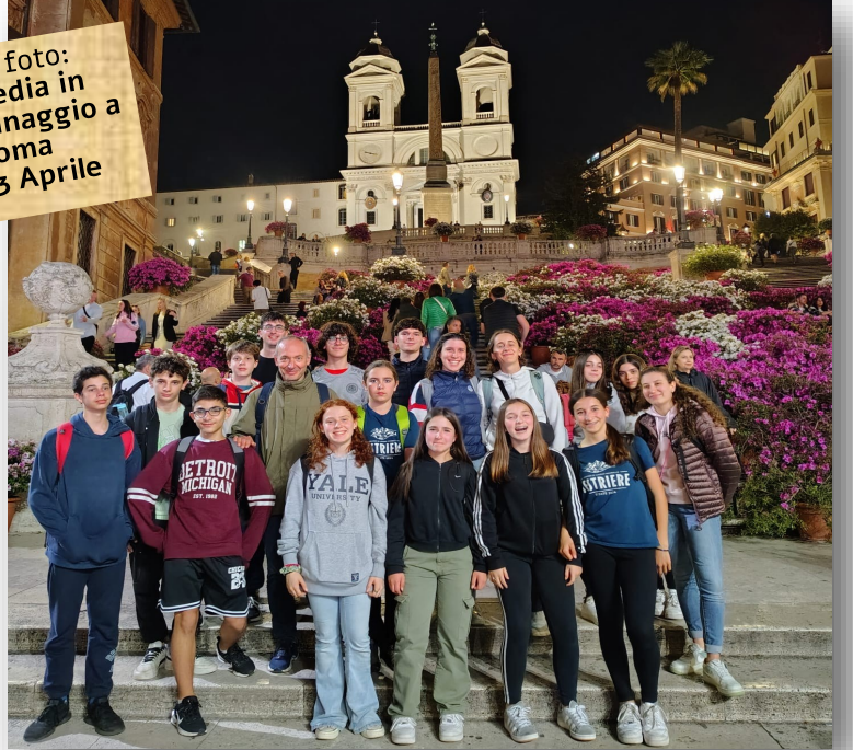
Nella foto: 3a media in pellegrinaggio a Roma 21-23 Aprile

Il prossimo incontro di Scuola di Cristianesimo , sarà il giorno 3 Maggio alle ore 16.30 sempre nella chiesa vecchia di Laveno prima della S.Messa vigiliare. Continueremo la lettura del primo capitolo della Sezione Seconda: "Io credo in Dio Padre" ( articoli di riferimento del Catechismo: da 422 a 570 ). Chi terrà l'incontro risponderà alle domande su questa parte.